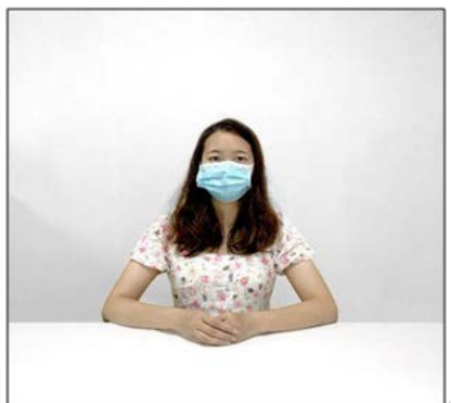
图2：正前方第一机位效果图