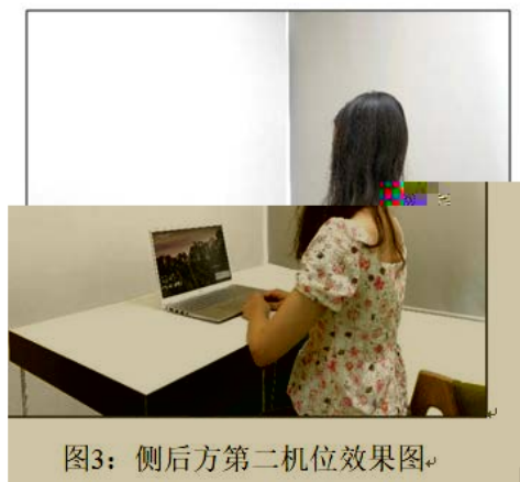
图3：侧后方第二机位效果图